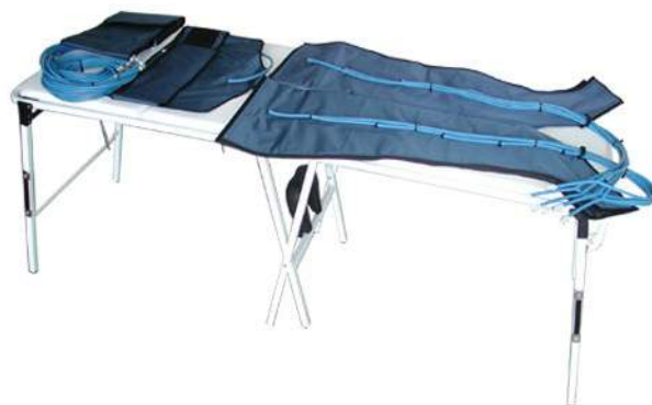
Esempio di applicazione dei gambali ACC.971