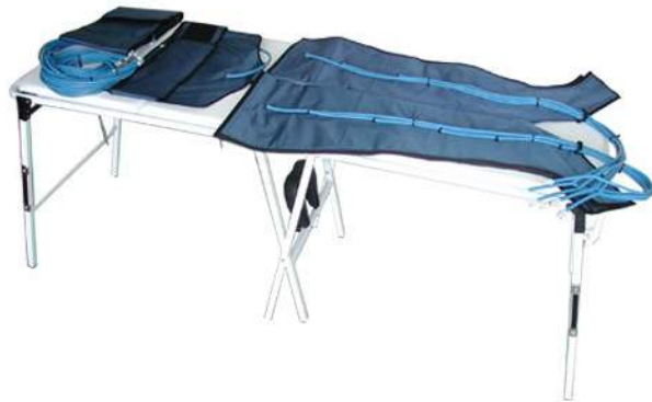
Esempio di applicazione dei gambali ACC.971