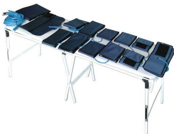
Esempio di applicazione delle fasce ACC.970